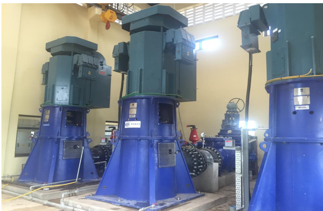
Pampu za Kusukuma Maji, Ruvu Juu.