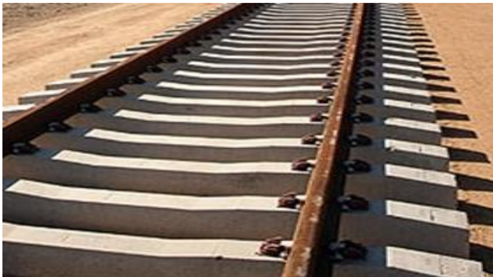
Muonekano wa njia ya reli ya kati kwa kiwango cha standard gauge itakapokamilika

Mradi huu unahusisha ujenzi wa reli ya kati kutoka Dar – Isaka-Kigali/Keza-Musongati (km 1,661) pamoja na ujenzi wa reli mpya ya kutoka Tabora – Kigoma, Kaliua – Mpanda and Isaka - Mwanza ( km 1,220) kwa kiwango cha Standard Gauge . Utekelezaji wa Miradi hii yote unaratibiwa na Shirika Hodhi la Rasilimali za Reli (RAHCO) chini ya Wizara ya Ujenzi, Uchukuzi na Mawasiliano (Uchukuzi).