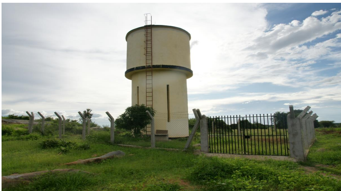
Tanki la mradi wa maji wa Vijiji Kumi katika Manispaa ya Shinyanga - Bushola likiwa limekamilika ambalo litahudimia watu 2,438, Januari 2016

kwa matumizi ya kijamii na kiuchumi kutoka asilimia 40 Julai, 2013 hadi asilimia 72 Machi, 2016 ambapo idadi ya wananchi walionufaika na huduma hiyo imeongezeka kutoka milioni 15.2 hadi milioni 21.9. Aidha, katika kuhakikisha kuwa miradi hiyo inakuwa endelevu, Jumuiya 909 za watumia maji zimesajiliwa.