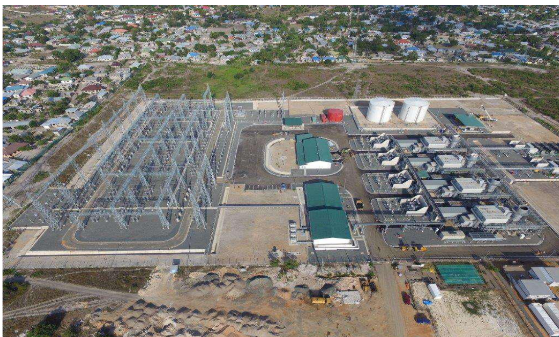
Mradi wa Kuzalisha umeme (MW 150) kwa kutumia Gesi Asilia wa Kinyerezi I ukiwa umekamilika, Desemba 2015.