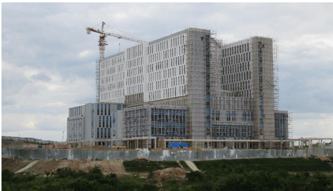
Ujenzi wa jengo la hospitali ya kufundishia ya Chuo Kikuu cha Afya na Sayansi Shirikishi Muhimbili Dar es Salaam - Kampasi ya Mlonganzila ukiendelea, Februari 2016