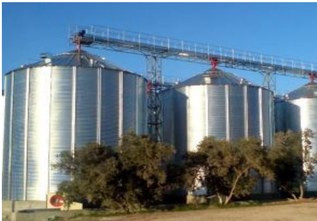
Muonekano wa vihenge vya kisasa - silo complex zitakazojengwa na NFRA