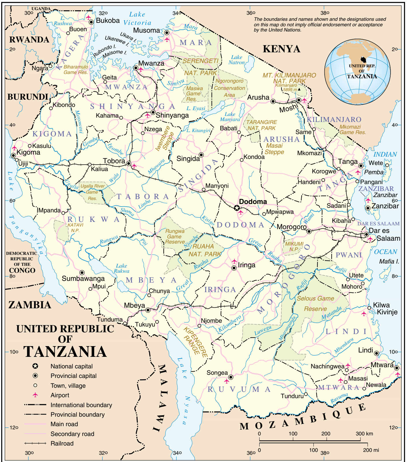
Map No. 3667 Rev. 6 UNITED NATIONS January 2006

Department of Peacekeeping Operations Cartographic Section